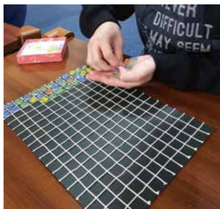
おはじきを枠の中へ早く置いていく「作業学習」

安心して、障がいのあるお子さんの子育てができるよう「親支援・家族支援」に全力で取り組んでいます。子育て中に起る色々な悩みを一人で抱え込んでしまい、苦しんでいる親御さんに寄り添いながら、「ぴあ」が一緒にお子さんの成長を育んでいきます。 そして、何よりもお子さんと職員の間、信頼関係の構築が第一と捉え、職員の間、情のもと、お子さんが安心できる環境を整えることに注力しています。