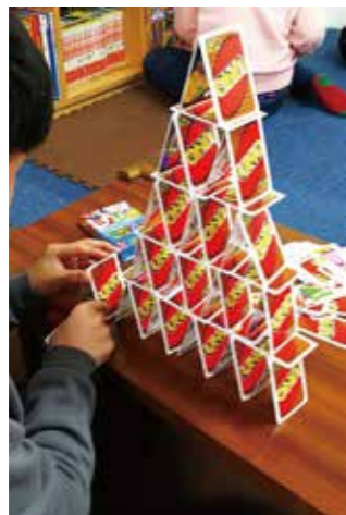
UNOカードで「カードタワー」。集中力が養われます

さらに、親御さん同士の交流やゲストを招いての研修会、更には施設見学会など、少しでも親御さん達が将来への展望を持てるようにサポートしています。